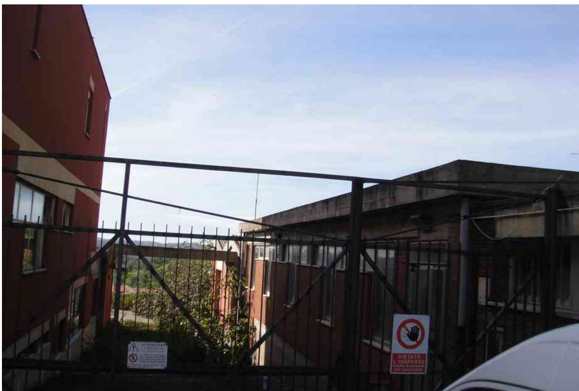
FOTO n° 2